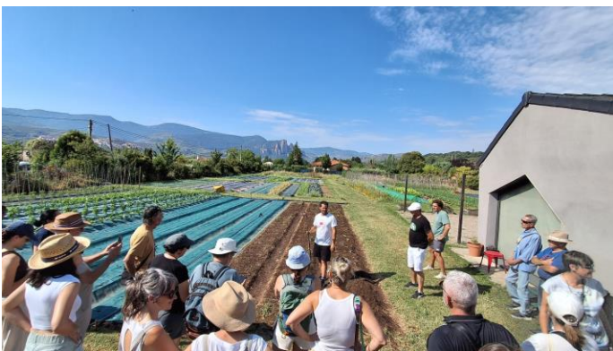
Foto 20. Visita a la Huerta de Rizos.