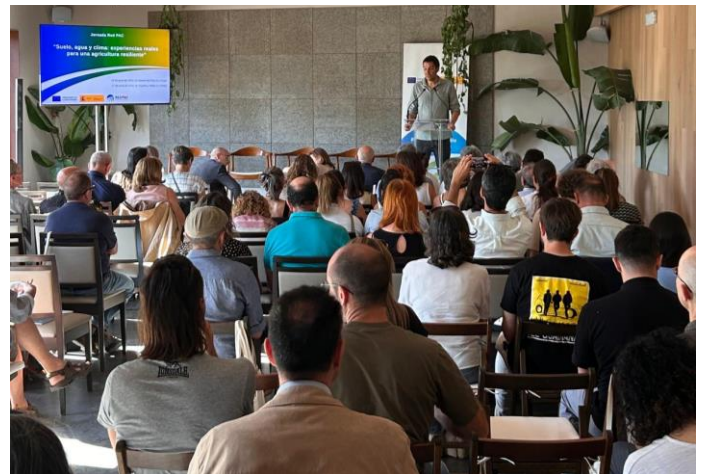
Foto 2. Inicio de la jornada.

Día 16 de junio, en Venta Moncalvillo, Daroca de Rioja: