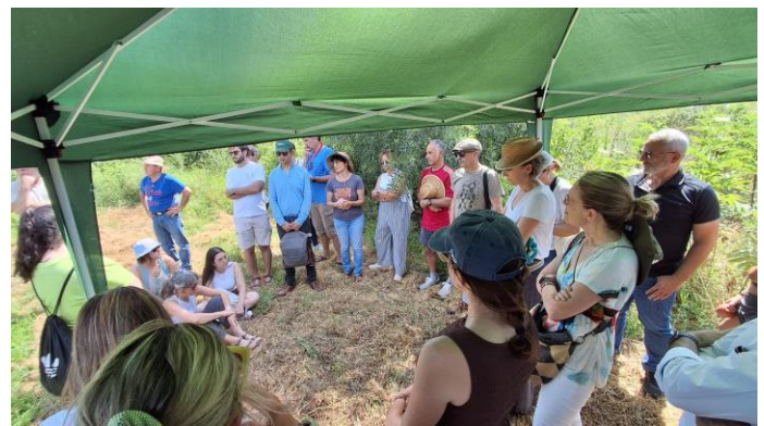
Foto 21. Visita a la Finca Revilla.