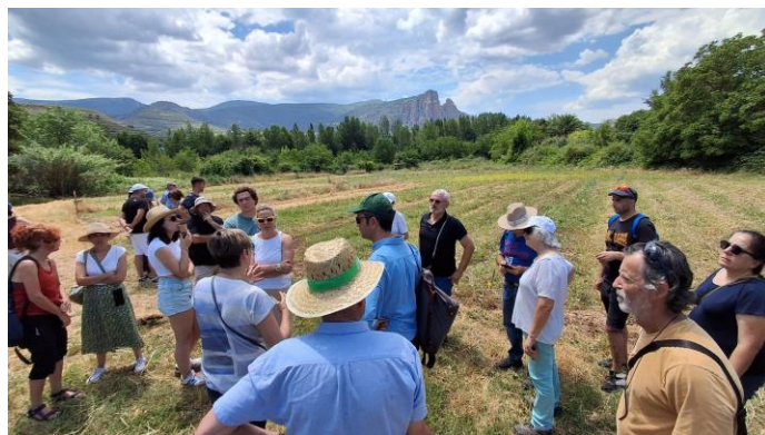
Foto 22. Visita a Finca Majuelos.