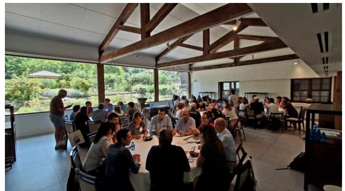
Fotos 17. Dinámica participativa de trabajo.

La dinámica participativa de trabajo tenía la finalidad general de crear un espacio ágil y útil donde perfiles diversos compartiesen problemas reales de suelo y agua para construir colaborativamente soluciones aplicables. Por tanto, entre sus objetivos están la identificación realista de barreras o problemas y la propuesta de soluciones reales , depuradas, que sean posibles de implementar en campo. Para ello, los asistentes se dividieron en 7 grupos, y en cada grupo se identificaron uno o varios problemas/barreras y soluciones vinculadas.