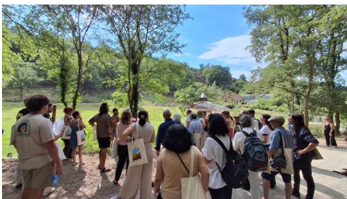
Foto 18. Visita a la granja Moncalvillo.