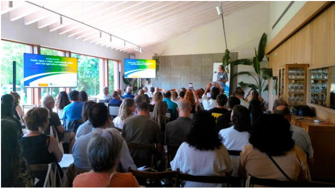
Foto 1. Asistentes a la jornada en Venta Moncalvillo.

Los días 16 y 17 de junio tuvo lugar la Jornada Red PAC "Suelo, agua y clima: experiencias reales para una agricultura resiliente". El evento se desarrolló en formato presencial en Venta Moncalvillo, en Daroca de Rioja (La Rioja), el día 16 de junio; y en fincas de los municipios de Sojuela y Nalda (La Rioja), el día 17 de junio. La jornada fue organizada por la Red PAC , perteneciente a la Subdirección General de Planificación de Políticas Agrarias del Ministerio de Agricultura, Pesca y Alimentación (MAPA) en colaboración con El Colletero .