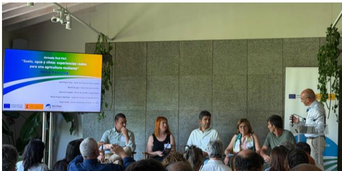
Foto 16. Mesa redonda de agricultores y agricultoras.