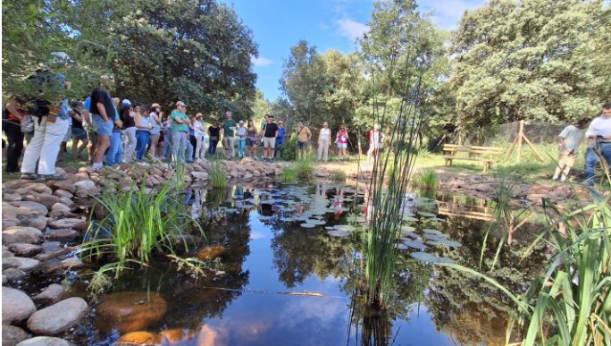
Foto 19. Visita a Finca Iraza.

lado, existe una charca de biodiversidad ubicada estratégicamente en una zona donde el terreno recoge de forma natural las aguas pluviales de los alrededores, cuyas funciones principales son el refugio de fauna, control biológico de plagas y el equilibrio ecosistémico (con plantas específicas que ayudan mantener la salud del entorno natural de la finca).