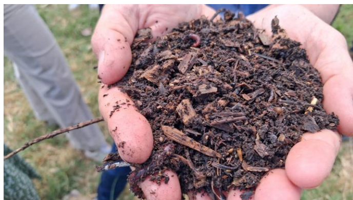
Foto 23. Muestra de compost en Finca Majuelos.