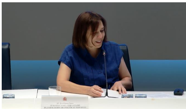
Foto 2. Eva García Sarro, subdirectora adjunta de Planificación de Políticas Agrarias (MAPA).

Eva García Sarro , subdirectora adjunta de Planificación de Políticas Agrarias (MAPA), inauguró la jornada de evaluación de la PAC destacando la diversidad de perfiles presentes, desde diferentes ámbitos de la administración pública hasta científicos y grupos de acción local, lo que refleja el carácter complejo y transversal del PEPAC y en concreto de su Plan de evaluación. Además, agradeció la implicación de todos los miembros del Comité de seguimiento del PEPAC y subrayó el papel estratégico de la Red PAC en la difusión de los resultados generados.