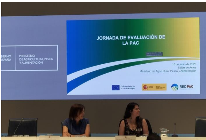
Foto 1. Primera mesa de inauguración e introducción a la Jornada de evaluación de la PAC.

El día 10 de junio tuvo lugar la jornada de evaluación de la PAC en el Salón de Actos del Ministerio de Agricultura, Pesca y Alimentación, Madrid. La jornada fue organizada por el Área de Evaluación del Plan Estratégico de la PAC en colaboración con la Red PAC, pertenecientes a la Subdirección General de Planificación de Políticas Agrarias del Ministerio de Agricultura, Pesca y Alimentación (MAPA).