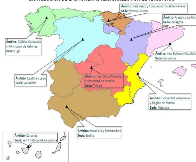
DISTRIBUCIÓN DE LAS ANTENAS REGIONALES POR EL TERRITORIO