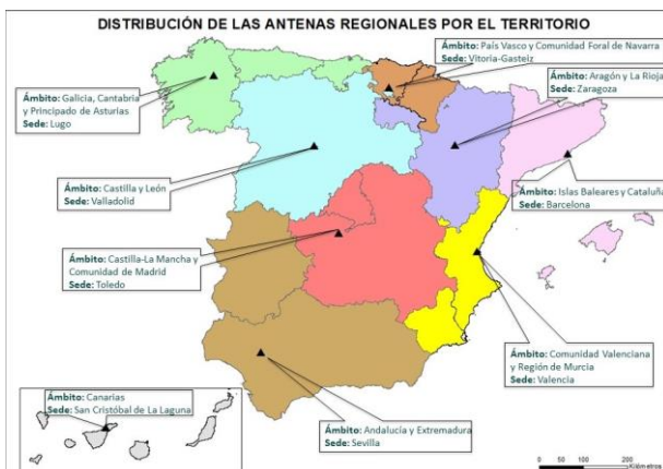
Mapa 1: Distribución del equipo de Antenas Regionales por el territorio.