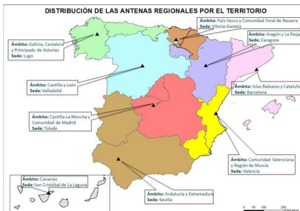
Mapa 1: Distribución del equipo de Antenas Regionales por el territorio.