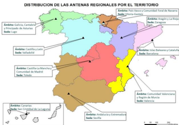
Mapa 1: Distribución del equipo de Antenas Regionales por el territorio.

Las tres ponentes, con diferentes proyectos y modelos de negocio distintos, han partido de situaciones diferentes, y coinciden en que todavía tienen que compaginar su proyecto en el mundo rural con otros trabajos. Aunque afirman que ha habido algunas mejoras en el medio rural que les ha facilitado la gestión de sus proyectos, como la conexión a internet, todavía existen problemas que se deben solucionar para facilitar el emprendimiento. La necesidad de simplificar los trámites administrativos, acceso a subvenciones del sector agroalimentario menos exigentes,