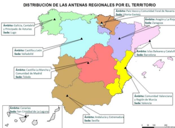
Mapa 1: Distribución del equipo de Antenas Regionales por el territorio.

Los tres proyectos coincidieron en destacar que es necesario una simplificación de los trámites administrativos, así como, una mejora en las conexiones a internet, que permita realizar ventas y contactos, con posibles clientes, de una forma rápida y de calidad. También vieron muy necesaria la creación de redes colaborativas en las zonas rurales, que aúne esfuerzos y facilite la salida de los productos y servicios al exterior, y la disposición de servicios básicos como las infraestructuras viarias o los servicios de paquetería en tiempo y forma.