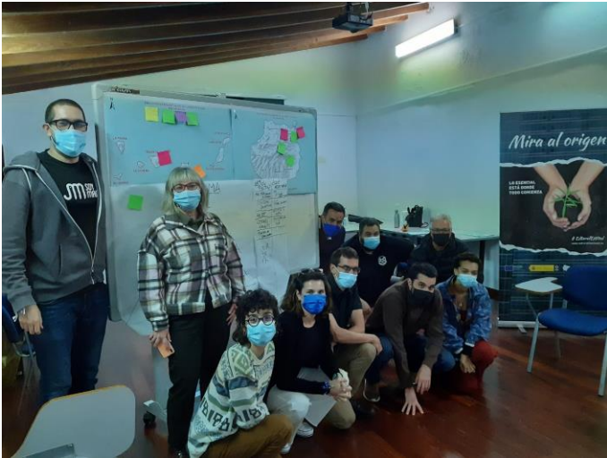
Foto 4: Participantes y dinamizadores del encuentro al final del mismo.

A su vez, se realizaron preguntas directas entre los y las participantes sobre cómo consideraban que podían colaborar entre ellas o cómo podían colaborar las personas jóvenes en general con alguna organización.