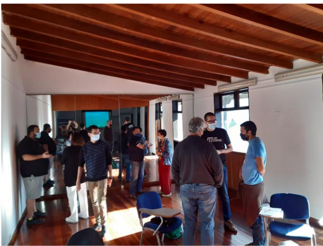
Foto 1: Dinámica rompehielos para que los participantes comiencen a conocerse y a hablar entre ellos.

Esta jornada presencial fue la undécima de una serie de 25 encuentros, la segunda de las dos que se realizaron en el archipiélago para este ciclo, y se celebró en la Casa de la Juventud de Vega de San Mateo, Gran Canaria.