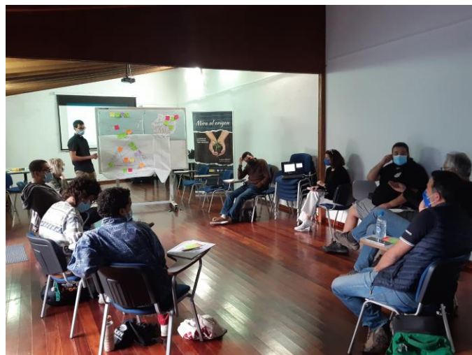
Foto 2. Momento del debate para establecer las relaciones entre las asociaciones y las entidades presentes.

A continuación, tuvo lugar una dinámica rompehielos en la que los asistentes se conocieron entre ellos de una manera informal.