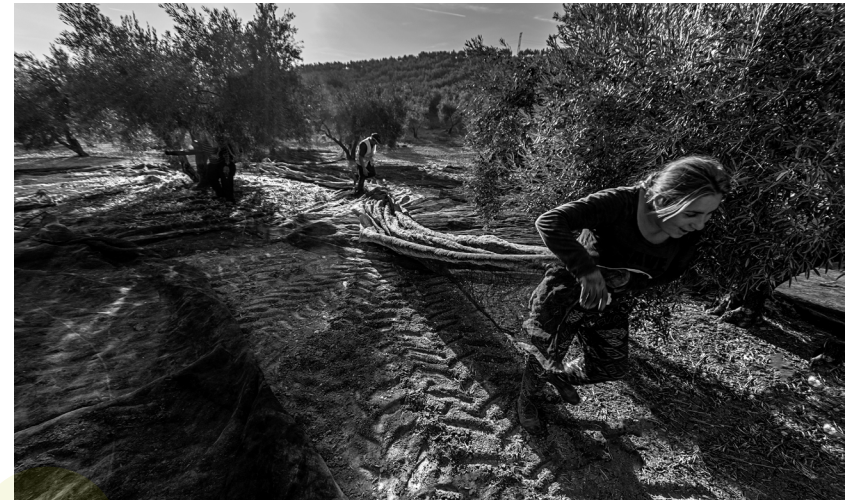
📷 CAMPIÑA DE JAÉN. JAÉN.

Un barrio histórico de más de 110 años. Un poco parado y mal pagados algunos sectores