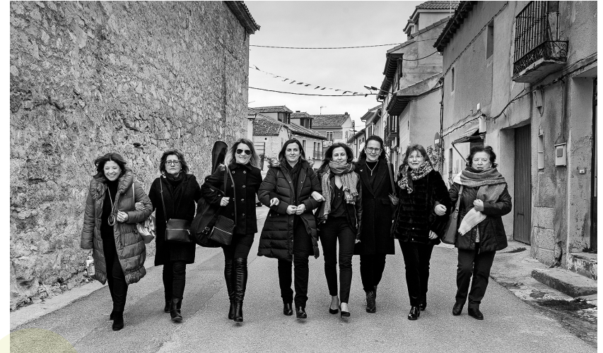
📷 ZAMARRAMALA. SEGOVIA.

Se vive muy tranquilo, pero es duro, porque se están despoblando los pueblos y cada vez les llegan menos recursos.