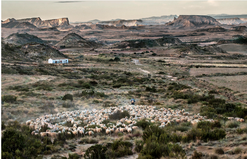
📷 CARCASTILLO. NAVARRA.