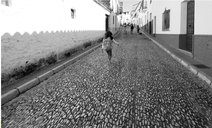
📷 GALAROZA. HUELVA.