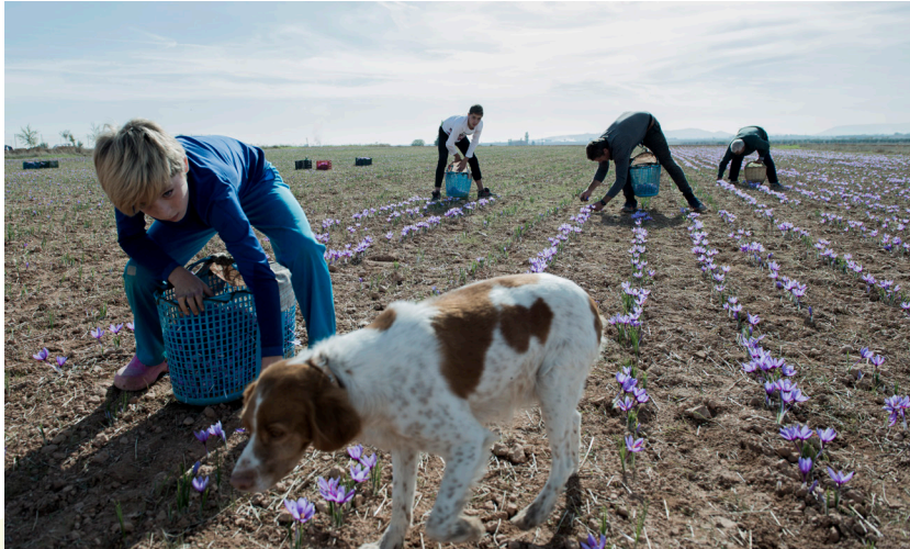
📷 VILLAFRANCA DE LOS CABALLEROS. TOLEDO.