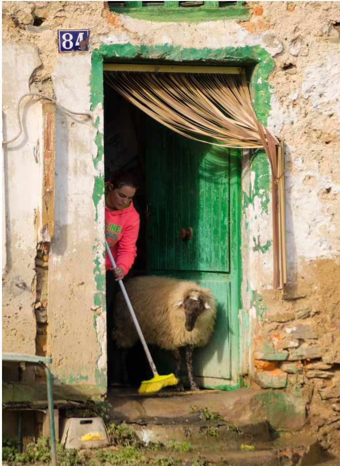
📷 BILBAO. BIZKAIA.