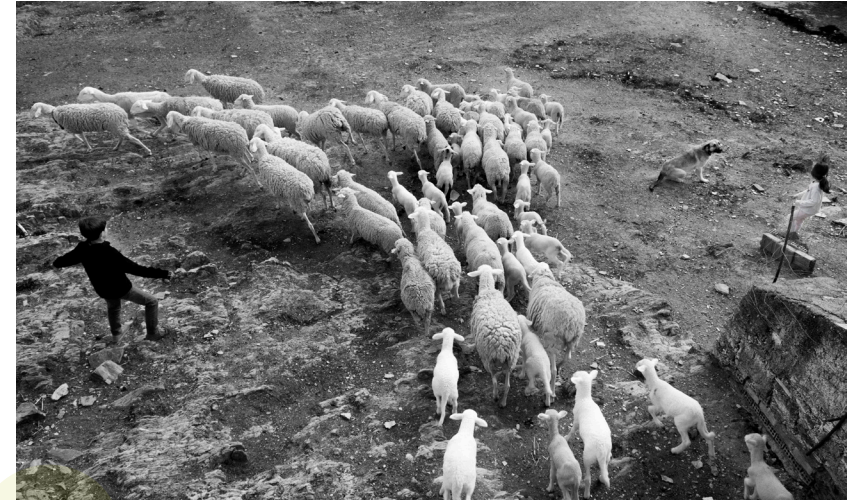
📷 LA NAVA. HUELVA.

El diálogo campo-ciudad es condición imprescindible para el fomento de actividades de emprendimiento rural. María acude a diario al colegio en el pueblo de Galaroza (Huelva), a varios kilómetros de su casa, situada en pleno campo del término municipal de La Nava. Galaroza, como cabecera de este territorio rural onubense, aporta una parte importante de los servicios propios de la vida actual.