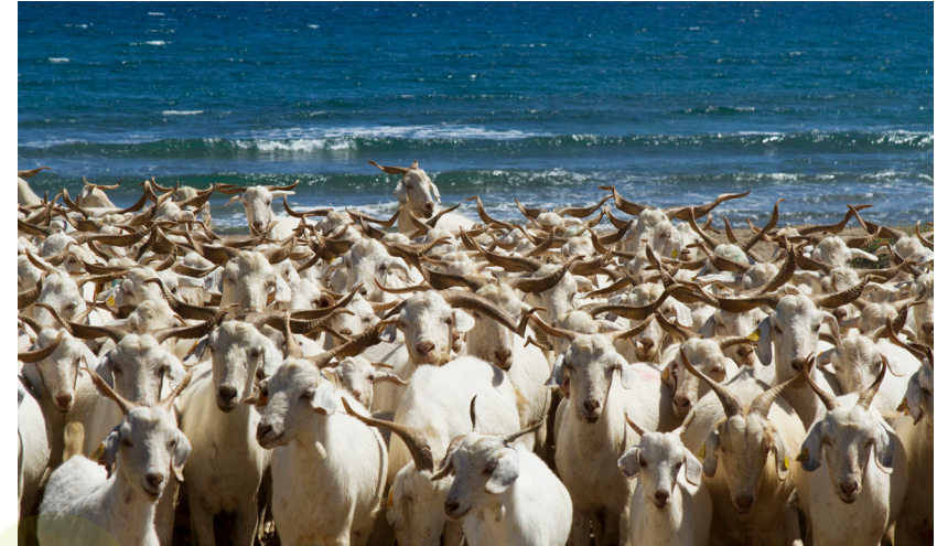
📷 COSTA MEDITERRÁNEA. ALMERÍA.

Mujer luchadora que sacó a su familia adelante sin apenas medios. Siempre realizaba varias tareas a la vez. Era feliz. Es vital que se realice una apuesta decidida por el medio rural, dotándolo con servicios públicos fundamentales.