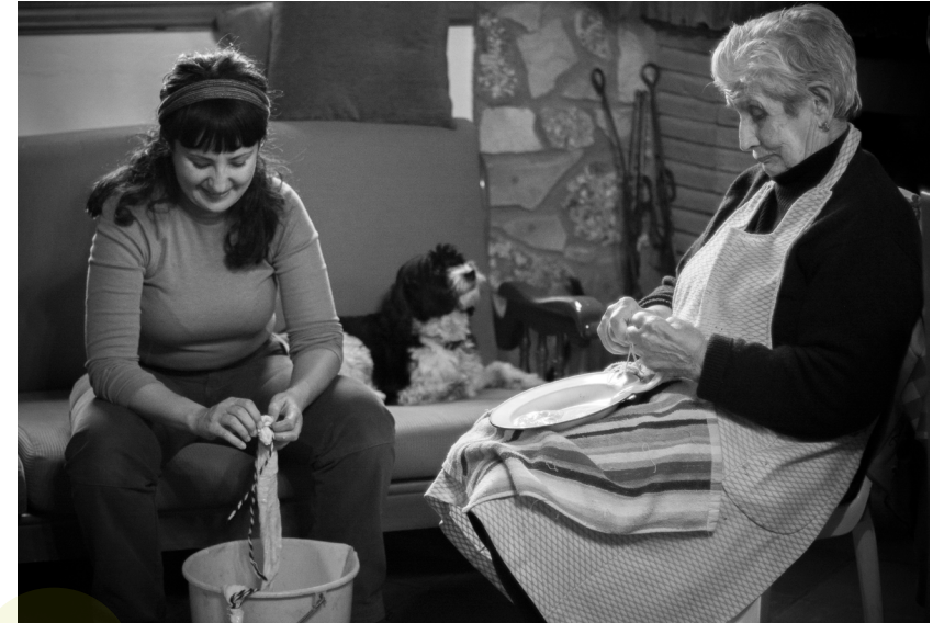
📷 BERLANGA DE DUERO. SORIA.

E ntrada a las Bárdenas para pasar el invierno. Cada día crece más y más profesional.