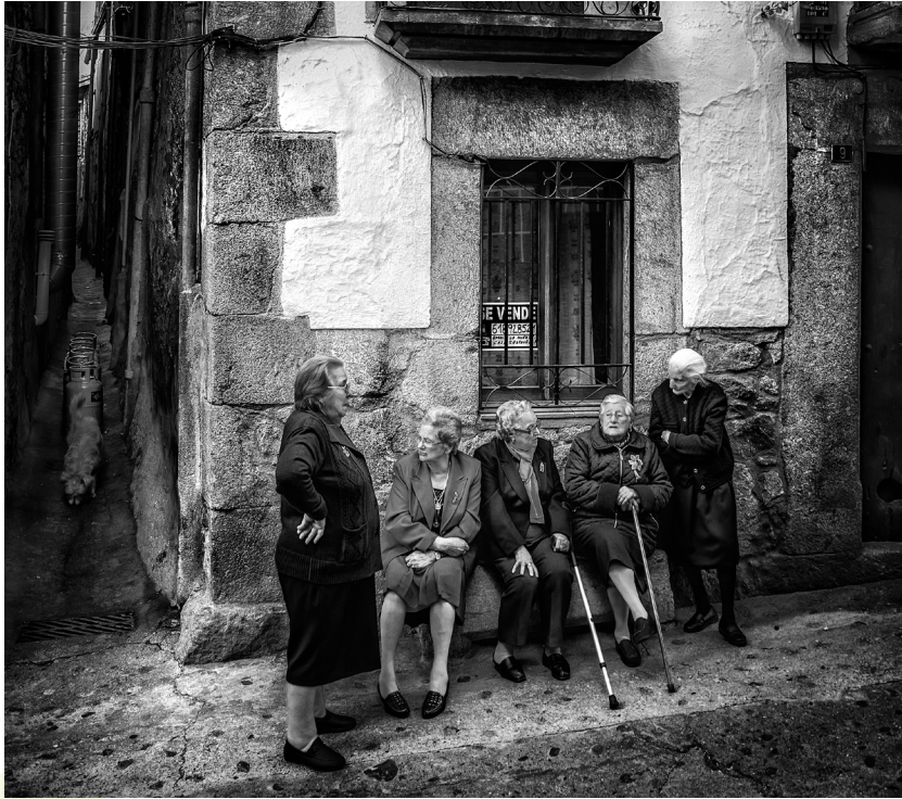
📷 GARGANTA LA OLLA. CÁCERES.