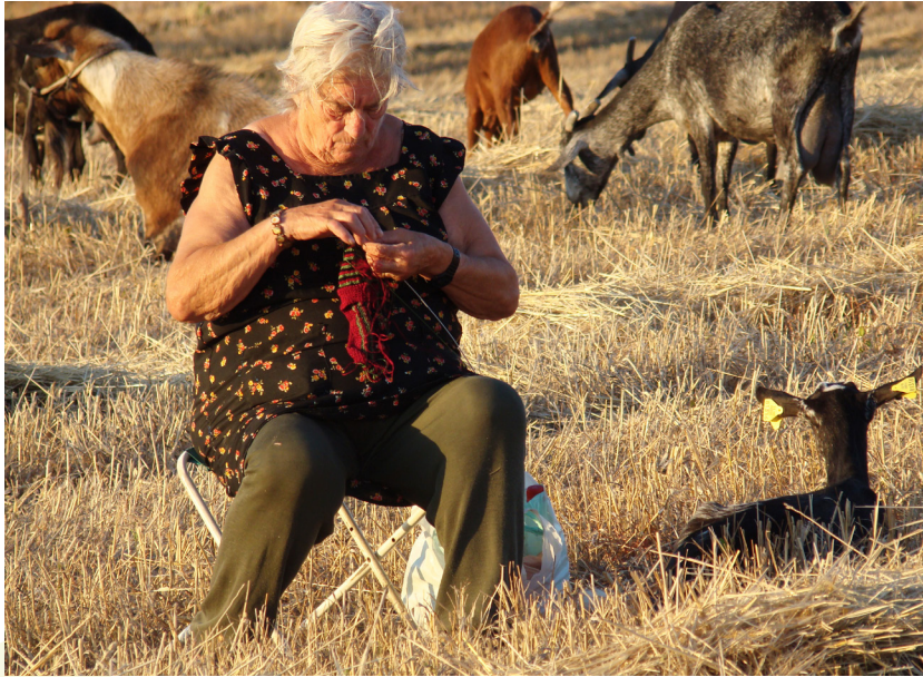
📷 PEAL DE BECERRO. JAÉN.