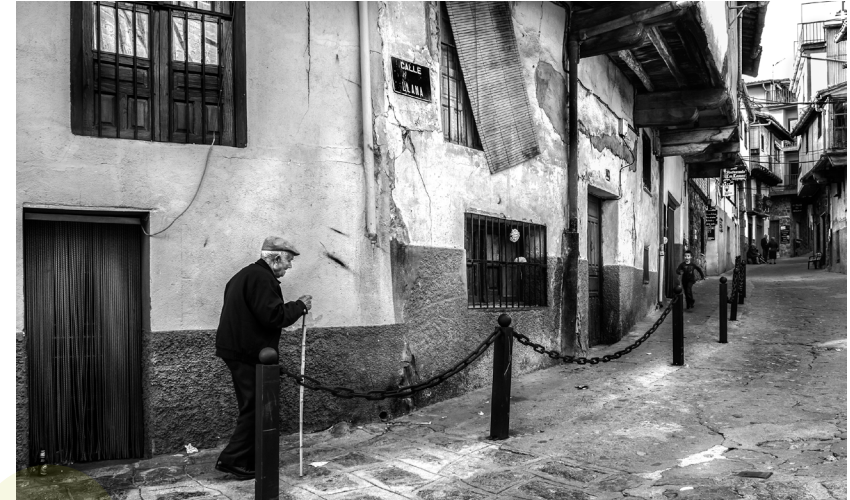
📷 GARGANTA DE LA OLLA. CÁCERES.

En este caso, son pequeñas explotaciones para la ayuda económica de las familias que todavía existen en La Mancha.