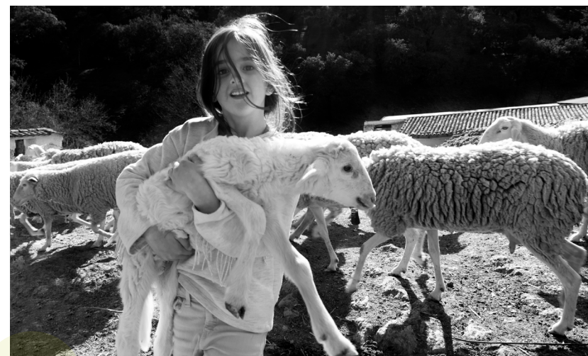
📷 LA NAVA. HUELVA.