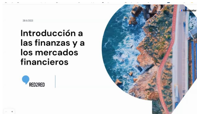
Foto 1: Presentación del contenido que se trató durante la jornada formativa.

Los días 28 y 29 de junio de 2023 se realizó la jornada formativa sobre conceptos básicos de financiación corporativa. En ella, se reunió al personal del Ministerio de Agricultura Pesca y Alimentación (MAPA) y de las comunidades autónomas interesadas en el uso de instrumentos financieros, con el objetivo de conocer los principales conceptos financieros y así adquirir conocimiento para la buena implementación del Instrumento Financiero de Gestión Centralizada.