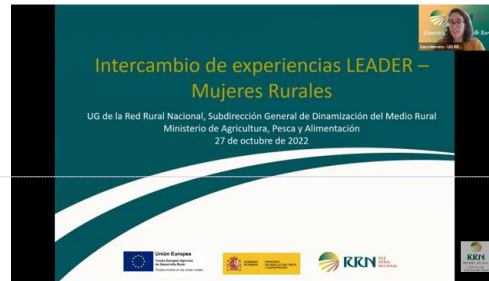
Foto 2: Presentación de las acciones de la RRN por parte de Sara Josefa Herrero. Unidad de Gestión de la RRN (MAPA).

acciones llevadas a cabo por la RRN en materia de mujeres en los últimos meses.