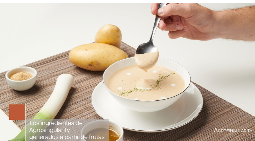
Los ingredientes de Agrosingularity, generados a partir de frutas y hortalizas no valorizados, son un ejemplo de economía circular.