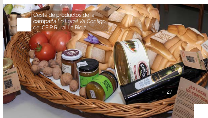
Cesta de productos de la campaña Lo Local Va Contigo , del CEIP Rural La Rioja.