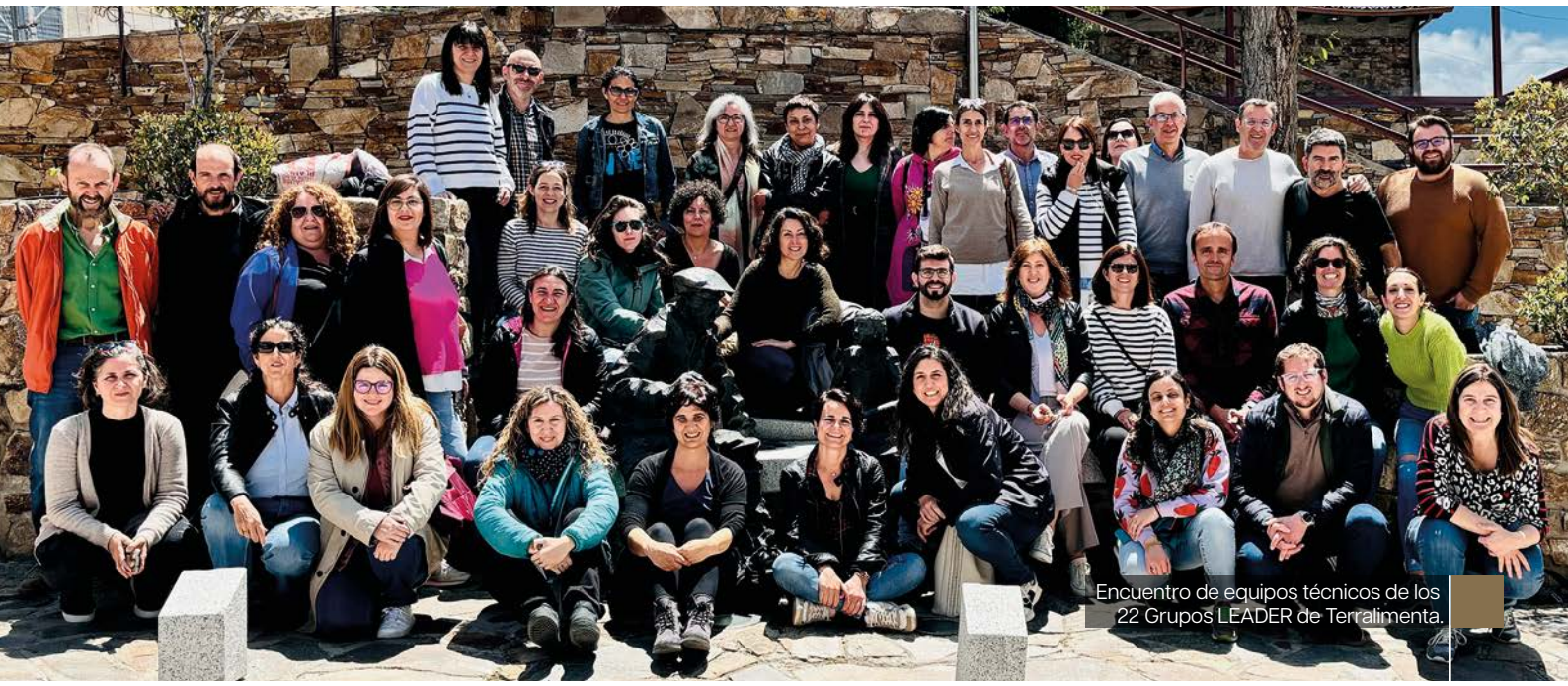
Encuentro de equipos técnicos de los 22 Grupos LEADER de Terralimta.