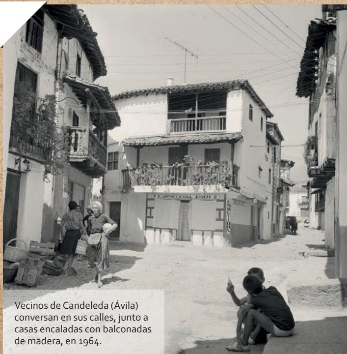
Vecinos de Candeleda (Ávila) conversan en sus calles, junto a casas encaladas con balconadas de madera, en 1964.