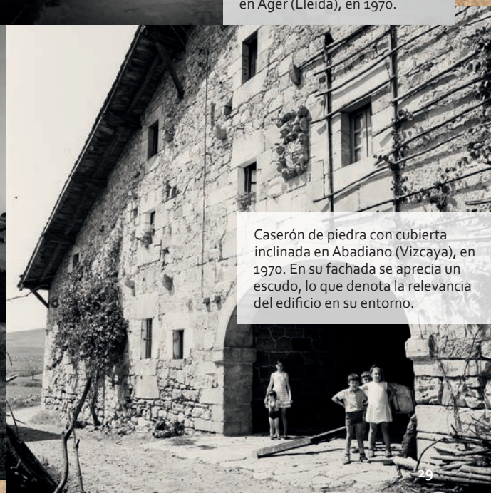
Caserón de piedra con cubierta inclinada en Abadiano (Vizcaya), en 1970. En su fachada se aprecia un escudo, lo que denota la relevancia del edificio en su entorno.