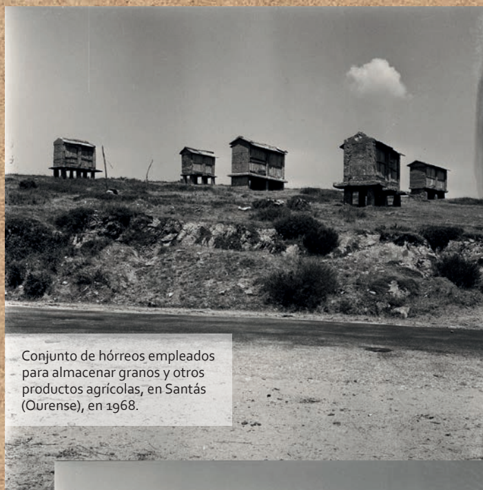
Conjunto de hórreos empleados para almacenar granos y otros productos agrícolas, en Santas (Ourense), en 1968.