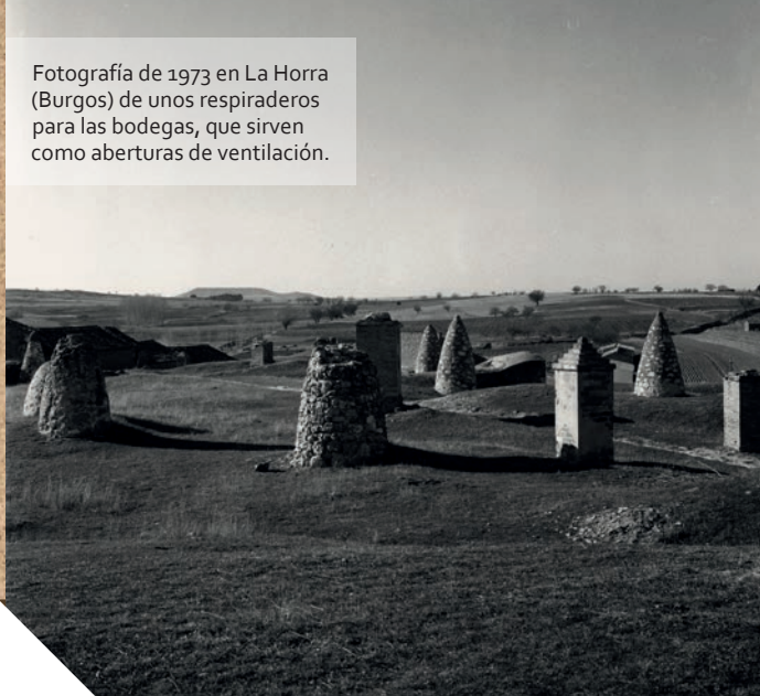
Fotografía de 1973 en La Horra (Burgos) de unos respiraderos para las bodegas, que sirven como aberturas de ventilación.