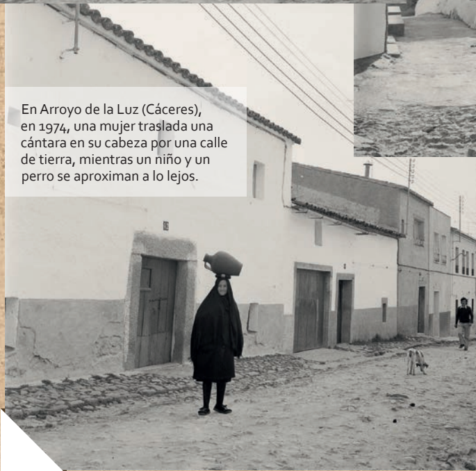
En Arroyo de la Luz (Cáceres), en 1974, una mujer traslada una cántara en su cabeza por una calle de tierra, mientras un niño y un perro se aproximan a lo lejos.