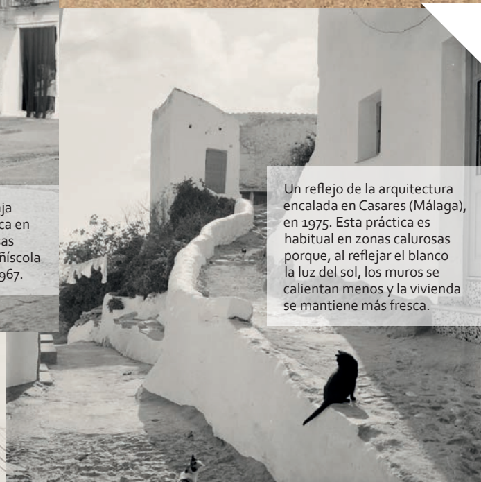
Un reflejo de la arquitectura encalada en Casares (Málaga), en 1975. Esta práctica es habitual en zonas calurosas porque, al reflejar el blanco la luz del sol, los muros se calientan menos y la vivienda se mantiene más fresca.