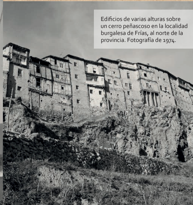
Edificios de varias alturas sobre un cerro peñosco en la localidad burgalesa de Frijas, al norte de la provincia. Fotografía de 1974.