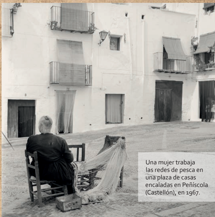
Una mujer trabaja las redes de pesca en una plaza de casas encaladas en Peñíscola (Castellón), en 1967.

Parte de este trabajo está digitalizado y disponible de manera gratuita en la página web del Museo Etnográfico de Castilla y León . A continuación, se recoge una pequeña muestra de esta mirada a la arquitectura popular. ■