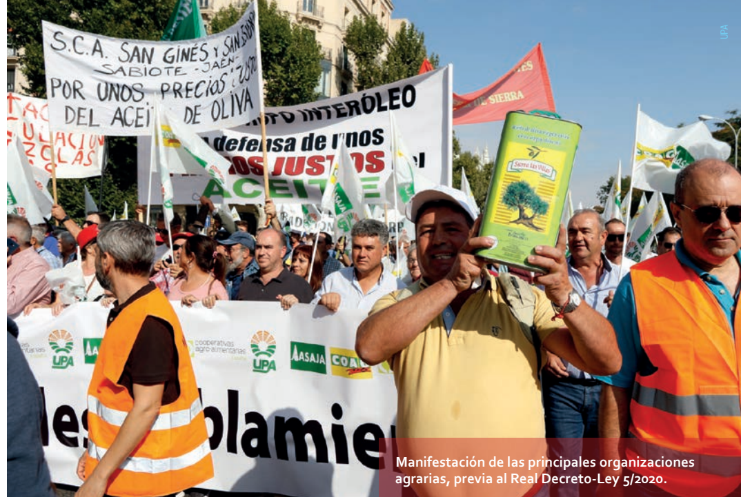
Manifestación de las principales organizaciones agrarias, previa al Real Decreto-Ley 5/2020.