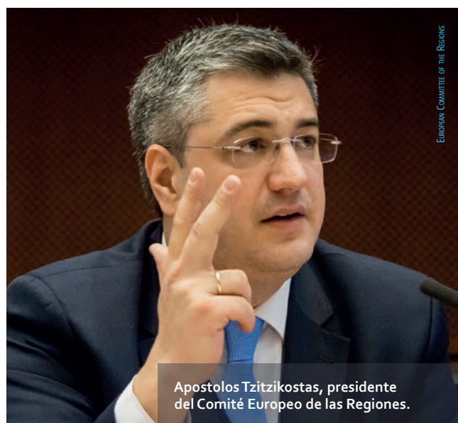
EUROPEAN COMMITTEE OF THE REGIONS