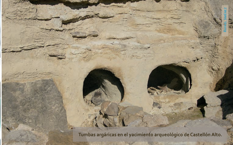
Tumbas argáricas en el yacimiento arqueológico de Castellón Alto.