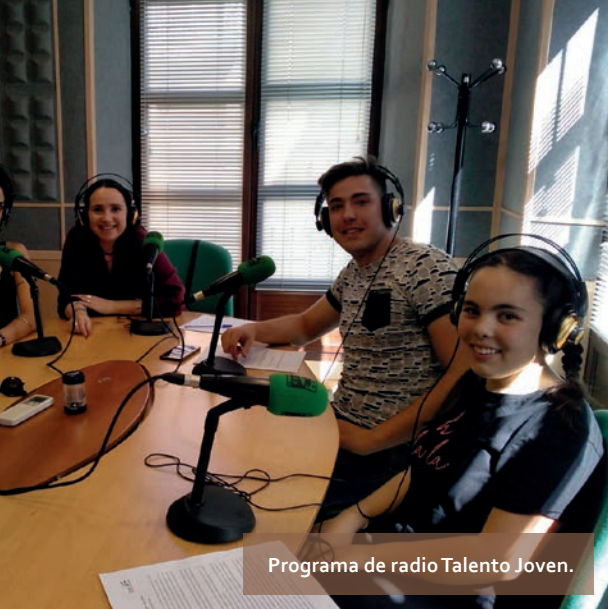
Programa de radio Talento Joven.