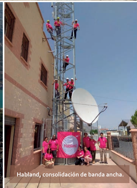
Habland, consolidación de banda ancha.