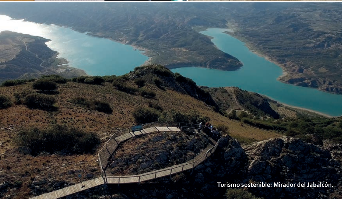
Turismo sostenible: Mirador del Jabalcón.