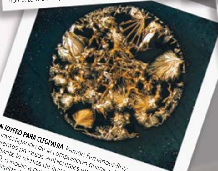
UN JOYERO PARA CLEOPATRA. Ramón Fernández-Ruiz La investigación de la composición química de los lixiviados de diferentes procesos ambientales en gamma-valerolactona (GVL), mediante la técnica de fluorescencia en gamma-valerolactona (TXRF), condujo a descubrir un mundo microscópico fascinante en las cristalizaciones de los residuos.