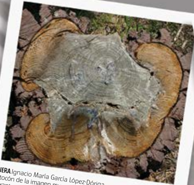
MIERA Ignacio María García López-Dóriga El tocón de la imagen muestra las cicatrices de un pino resinado durante veinticinco años. La silvicultura aplicada y la estrecha relación de los habitantes del medio rural con los pinares de Pinus pinaster han sido una garantía de conservación de nuestros montes.