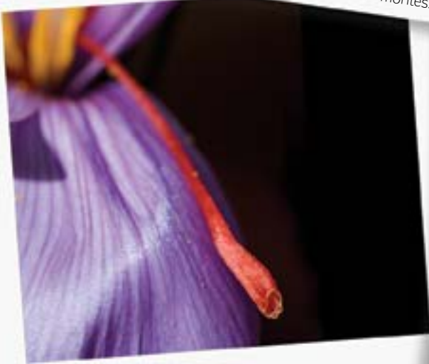
FLOR DE AZAFRÁN. Philippe Imbault Crocus sativus , la flor de azafrán, el "oro vegetal". La floración dura dos meses. Hacen falta 250 flores para obtener 1 gramo de azafrán. En una hora una persona recoge mil flores y extrae los estigmas (la monda) de 500 flores. La última operación consiste en secarlo.