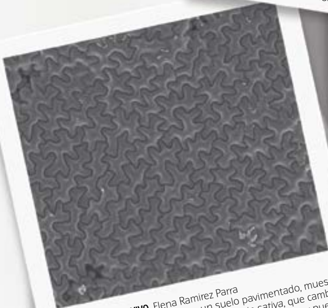
PAVIMENTO VEGETAL VIVO. Elena Ramirez Parra Esta composición, que asemeja a un suelo pavimentado, muestra la superficie de una hoja de la legumbre Vicia sativa, que cambia en forma y tamaño a lo largo del desarrollo de la planta y puede acumular ceras protectoras contra la sequía.