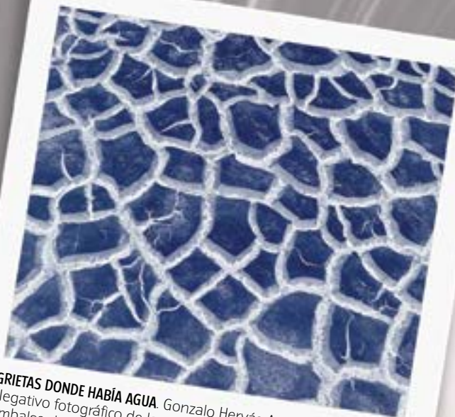
GRIETAS DONDE HABÍA AGUA. Gonzalo Hervás Angulo Negativo fotográfico de las grietas ocasionadas en el fondo del embalse de Luna (León) provocadas por la falta de agua. Estos fractales "microscópicos" sirven para reflexionar y concienciar a toda la sociedad sobre los devastadores efectos del cambio climático en nuestros ecosistemas.

En esta edición han participado 729 fotos. Hemos seleccionado algunas con un vínculo a las actividades que se llevan a cabo en el mundo rural.