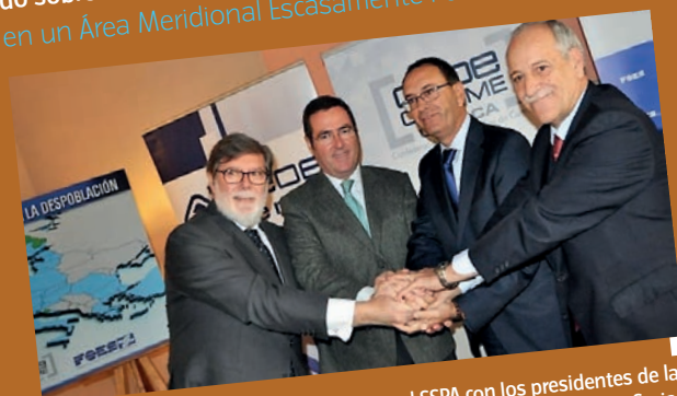
Constitución de la red SSPA con los presidentes de las federaciones de empresarios de Cuenca, Soria y Teruel, acompañados por el presidente de Cepyme.

se identifican las regiones con desventajas demográficas graves y permanentes; el TFUE (Tratado de Funcionamiento de la Unión Europea), en cuyo artículo 174 se plantea la posibilidad de reclamar la "especial atención" para estos territorios; y finalmente el documento realizado sobre estas bases Cuenca, Soria y Teruel y su encaje en un Área Meridional Escasamente Poblada .