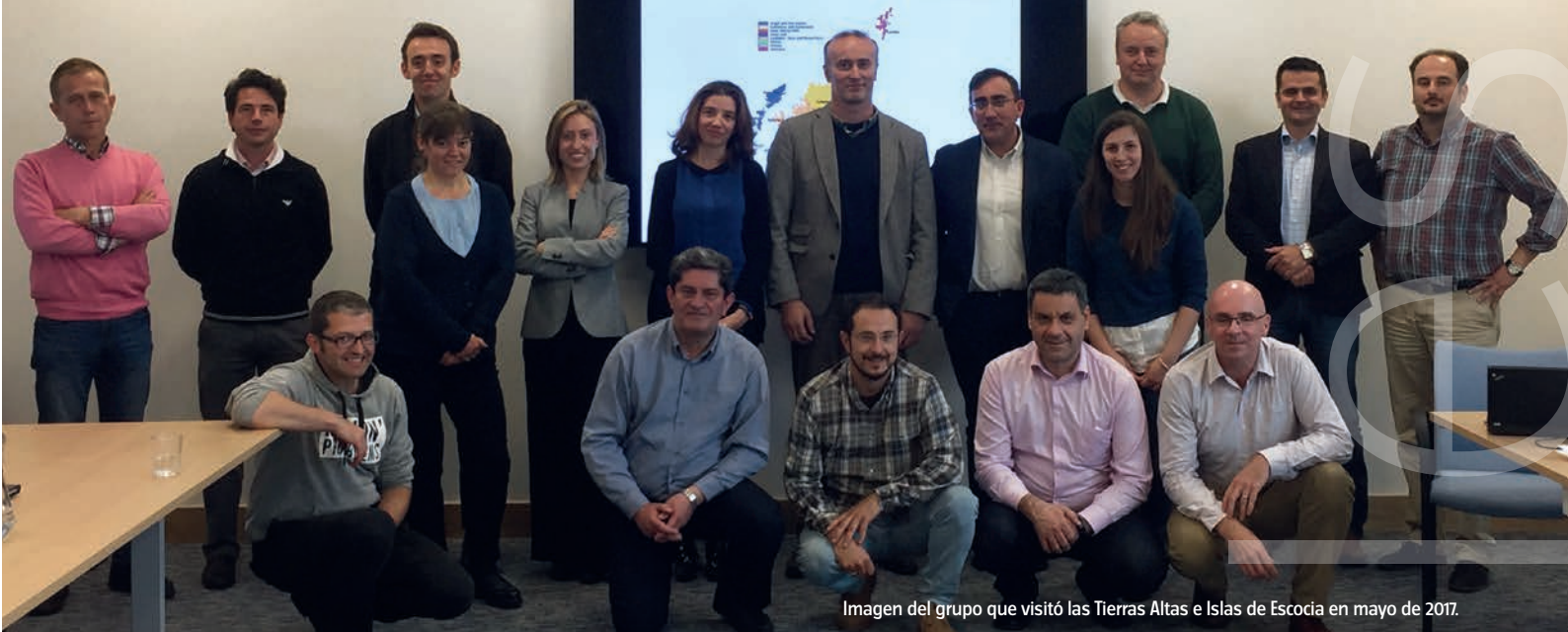
Imagen del grupo que visitó las Tierras Altas e Islas de Escocia en mayo de 2017.

rural con fuertes desventajas naturales y demográficas.