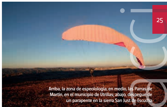
Arriba, la zona de espeleología; en medio, las Parras de Martín, en el municipio de Utrillas; abajo, despegue de un parapente en la sierra San Just de Escucha.